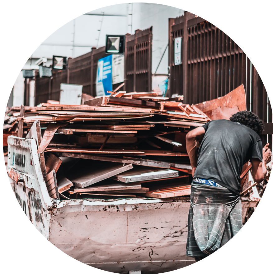
Gestão integrada de Resíduos