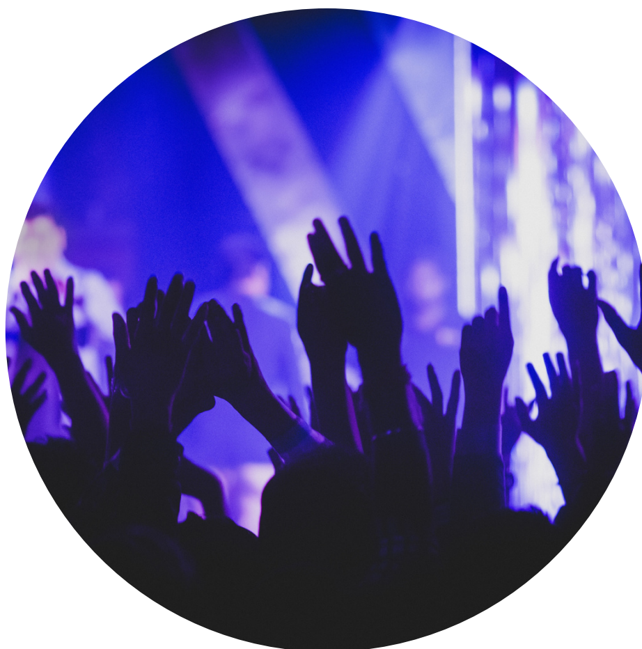
Iluminação em Led